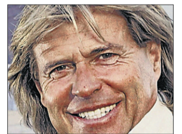
Hansi Hinterseer

KOPENHAGEN. Die neue CD des Nordtiroler Schlagerstars Hansi Hinterseer (56), „Ich hab' dich einfach lieb“, führt die dänischen Charts an. Damit ist der Kitzbüheler gleich zweimal in den Top-20 der dortigen Album-Charts vertreten: Seine Doppel-CD „The Danish Collection“, über vier Wochen die Spitze dominiert hatte, steht aktuell auf Platz elf.